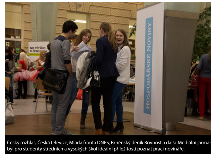
Český rozhlas, Česká televize, Mladá fronta DNES, Brněnský deník Rovnost a další. Mediální jarmark byl pro studenty středních a vysokých škol ideální příležitostí poznat práci novináře.