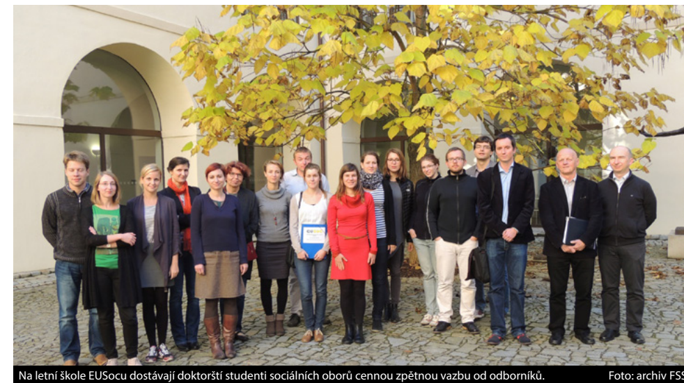
Na letní škole EUSOCu dostávají doktorští studenti sociálních oborů cennou zpětnou vazbu od odborníků.

Nové poznatky pro své disertace, ale také kontakty pro mezinárodní akademickou spolupráci získávají každý podzim doktorští studenti ze zemí střední Evropy na konferenci EUSOC. Doktorandi prezentují příspěvky, účastní se diskuse, opoují práci kolegů a dostávají zpětnou vazbu od odborníků. Na fakultě sociálních studií se mezioborová letní škola pořádá už čtrnáct let.