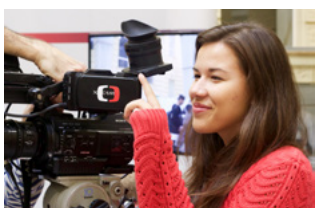
Multimediální den > s. 7