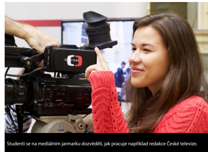
Studenti se na mediálním jarmarku dozvěděli, jak pracuje například redakce České televize.