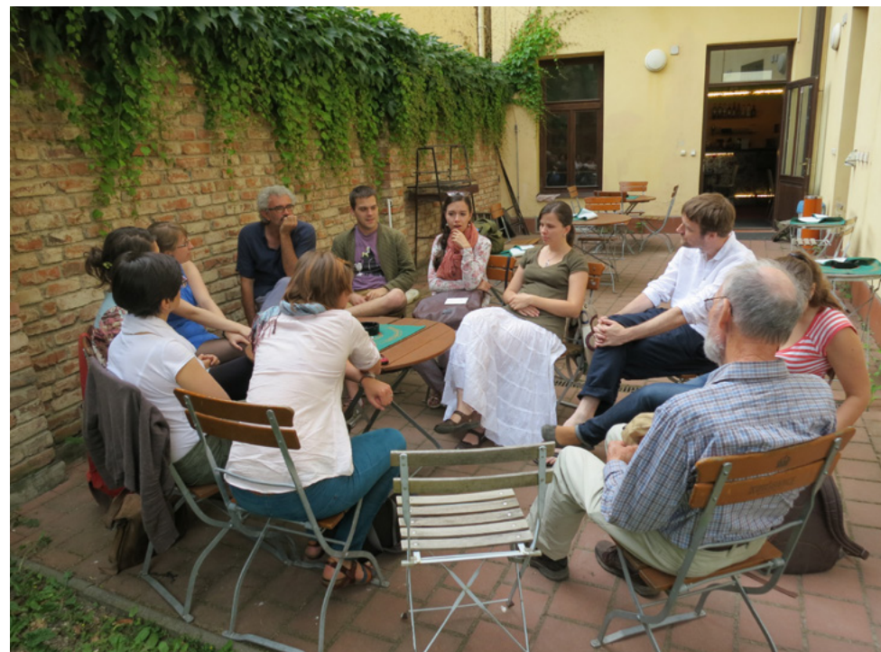
Katedra sociologie zorganizovala diskusní setkání mimo fakultu.

diagnostickými metodami a žurnalisté získali nové televizní studio s nejmodernějším vybavením.