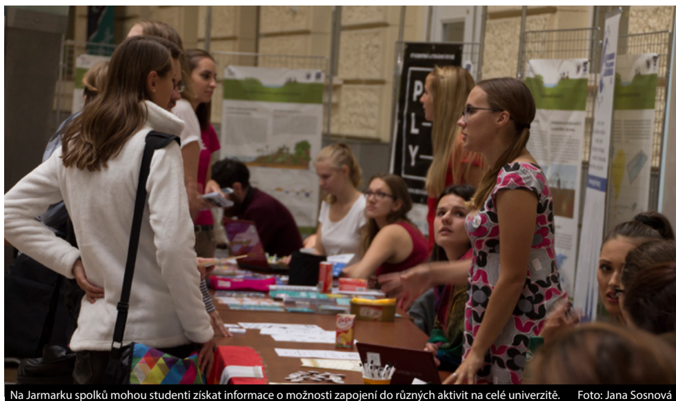
Na Jarmarku spolků mohou studenti získat informace o možnosti zapojení do různých aktivit na celé univerzitě.

Na tom, že se při studiu vyplatí dělat i něco navíc, se asi shodne většina studentů. A ocení to i budoucí zaměstnavatelé. Jednou z možností, jak získat zkušenosti i cennou praxi při studiu, jsou studentské spolky. Jenom na fakultě sociálních studií jich funguje víc než deset a na celé univerzitě přes dvacet.