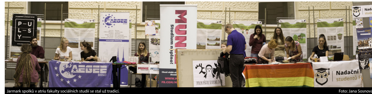
Jarmark spolků v atriu fakulty sociálních studií se stal už tradicí.

Na fakultě sociálních studií aktivně funguje více než deset spolků, ve kterých se sdružují budoucí novináři, politologové nebo environmentalisté. Kromě zábavy a nových přátel se stejnými koníčky však spolky studentům nabízejí i cennou praxi – naučí se organizovat různé akce, spolupracovat v týmu, vytvořit si názor, psát o odborných tématech nebo prezentovat. Zapojit se do činnosti spolků může kdokoliv.