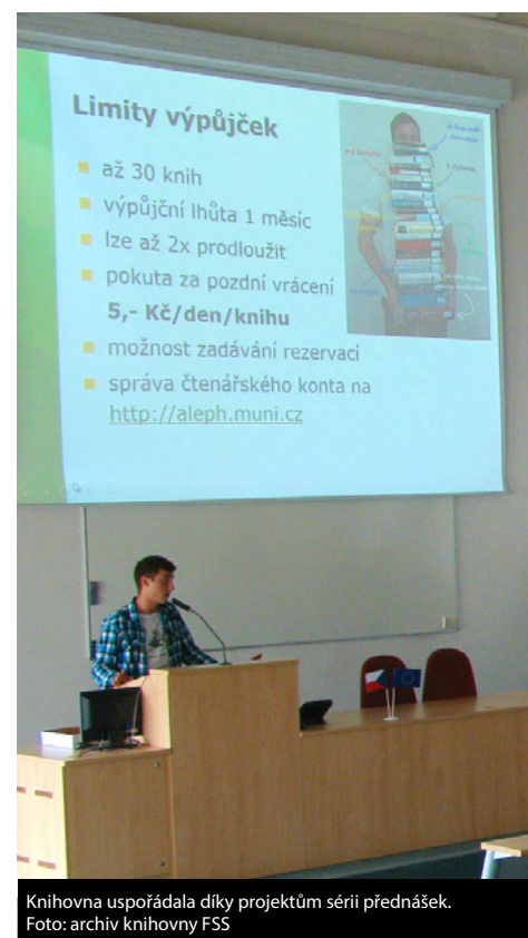
Knihovna uspořádala díky projektům sérii přednášek.

„Podmínkou pro absolvování doktorského studia by do budoucna měl být semestrální výjezd do zahraničí,“ přiblížil Macek. Zintenzivnit chce také publikační činnost doktorandů a v plánu je i podpora takzvaných soft-skills, kam patří například psaní článků, prezentování na konferencích a podobně. „Chceme také přidat nové doktorské programy tam, kde zatím chybí – jde například o mediální studia či pedagogickou psychologii,“ doplnil Macek.