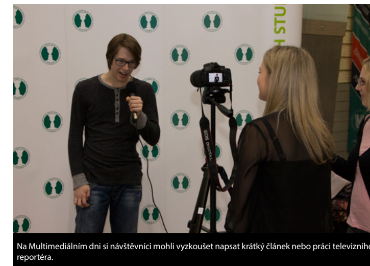
Na Multimediálním dni si návštěvníci mohli vyzkoušet napsat krátký článek nebo práci televizního reportéra.