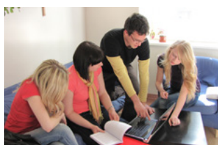
Inspirativní fakulta > s. 8